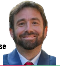
Béranger Cernon, La France Insoumise Député de l'Essonne

Soutien plein et entier à la liste de gauche de Saintry. Une liste inspirante et qui amènera un changement profond à la politique actuelle. Des hommes et des femmes au service de leur commune, au service des autres, au service du bien commun.